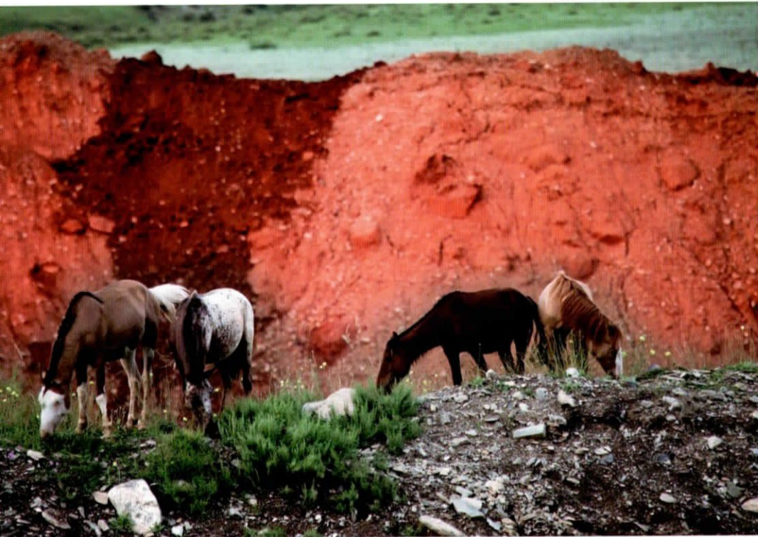
Ар Наймган дахь адуун сүрэг / Ar Naimgan mountain