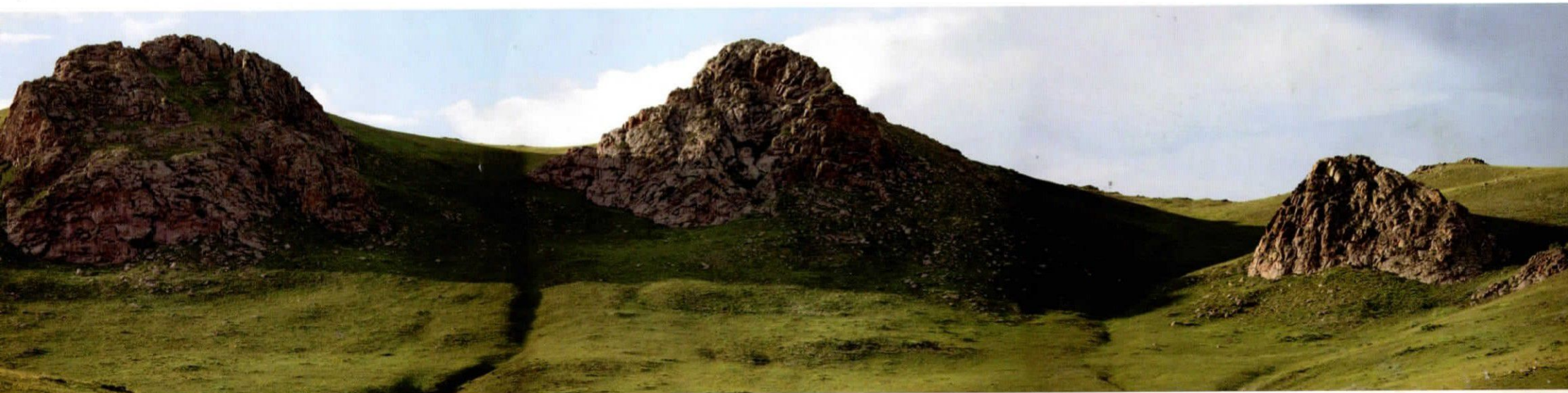
Гурван Улааны асгар / Gurvan Ulaan mountain