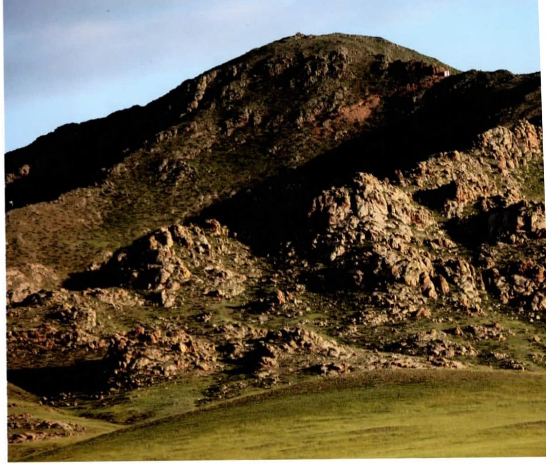
Баржин хайрхан / Barjin khairkhan mountain