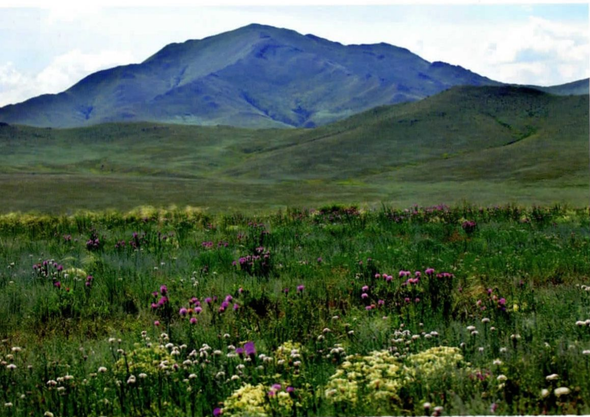
Үзэсгэлэнт Дайв уул The beautiful mountains of Daiv (1530 meters above sea level)