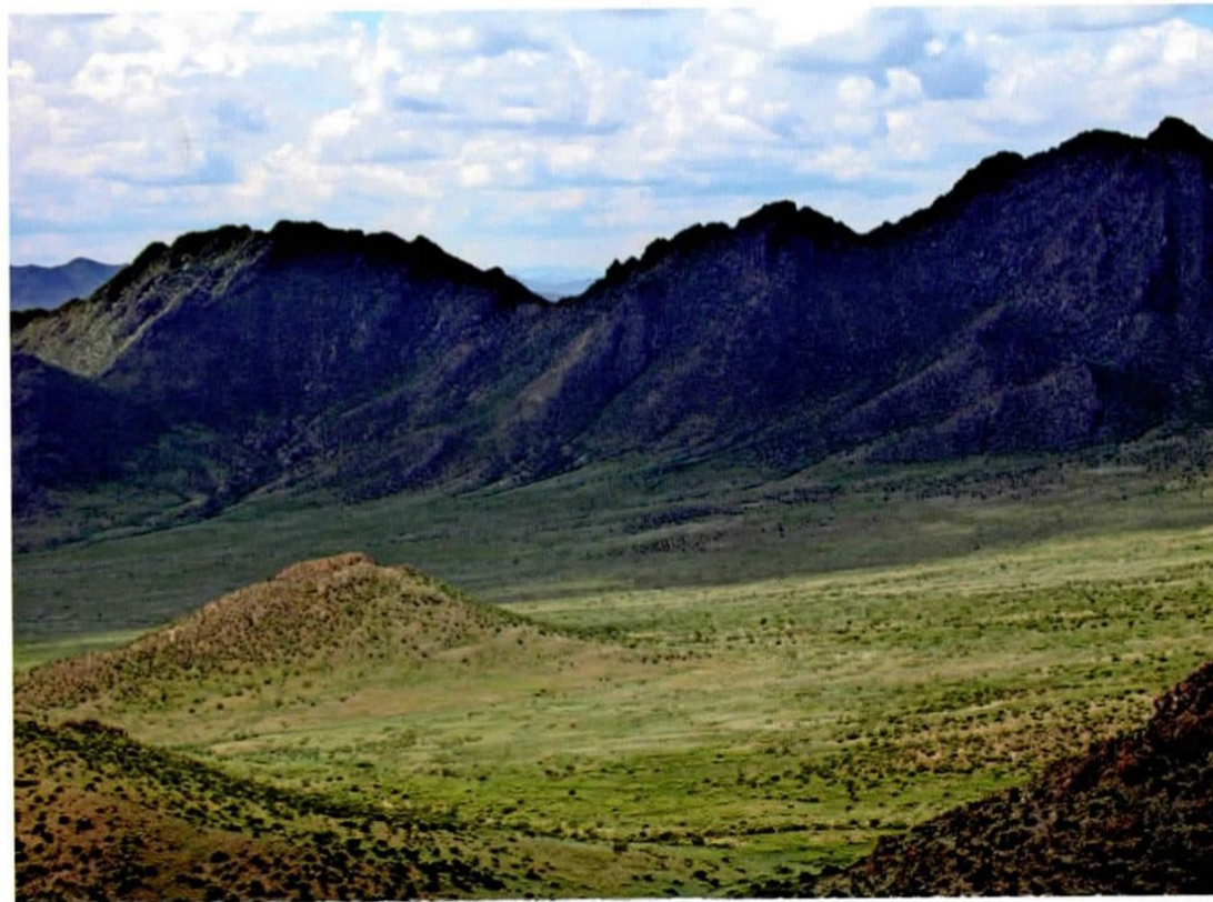
Цогт хунтайжийн ав хийдэг байсан Хангайн ханы нуруу / Khangai khan mountains