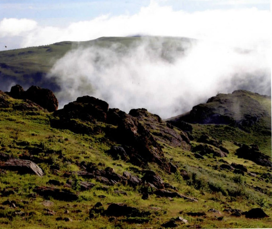
Авдарт хайрханы ар царам / Avdart khairkhan mountain