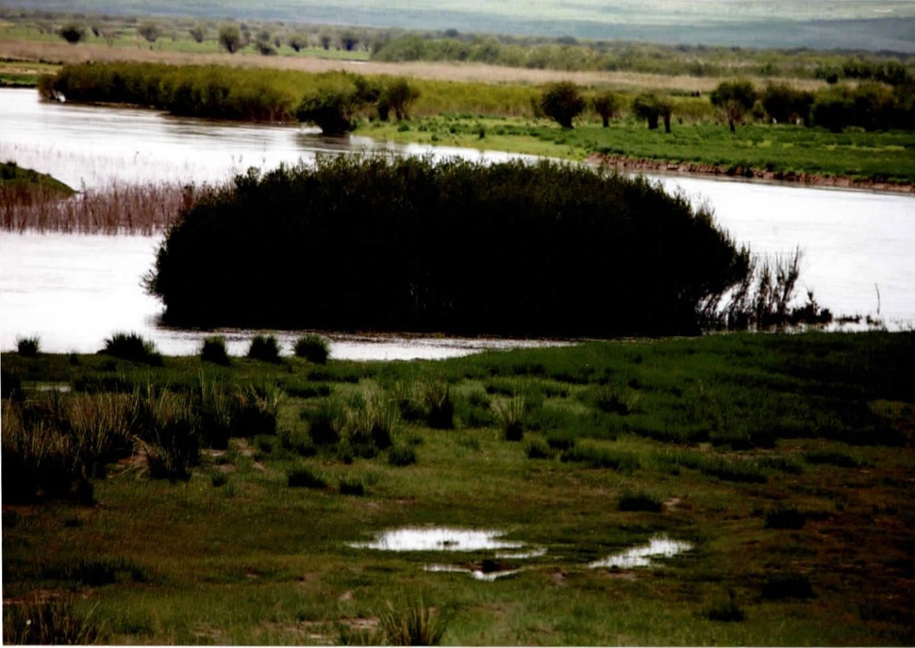
Хатан Туулын бараа / The sight of the Tuul river.